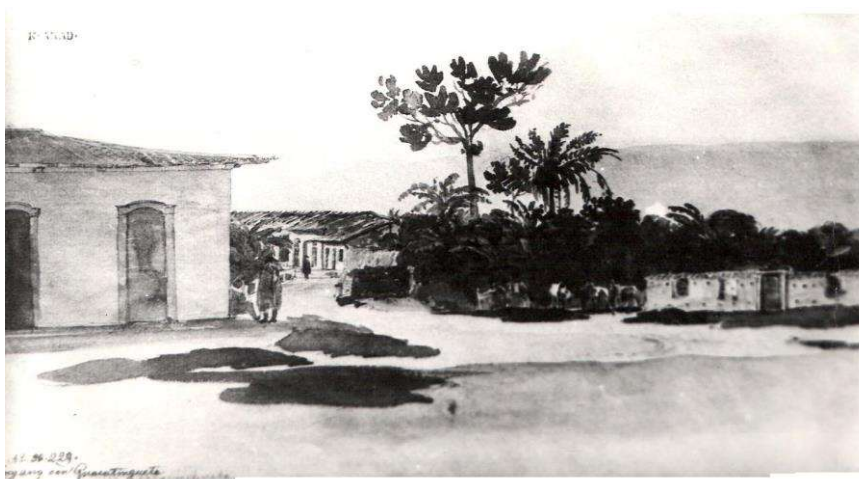
A Vila - Aquarela de Thomas Ender, 1817.

Índios, ouro, caminhos, descaminhos, piratas, tropas e tropeiros, engenhos e muito comércio, são alguns dos personagens da história da Vila de Santo Antônio de Guaratinguetá que teve o seu início por volta de 1630 e começou a se desenvolver a partir do século dezoito.