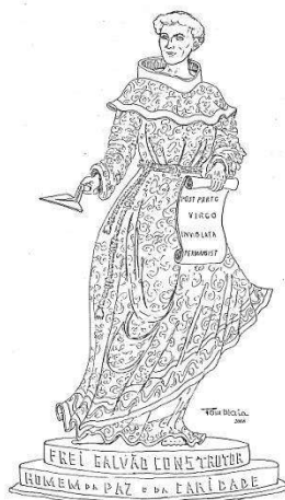
Museu Frei Galvão – Arquivo Memória de Guaratinguetá julho/2025.

Espera-se que o novo título dê novo rumo à história de Guaratinguetá, valorizando a gente e a terra de Frei Galvão para o Brasil e o mundo.